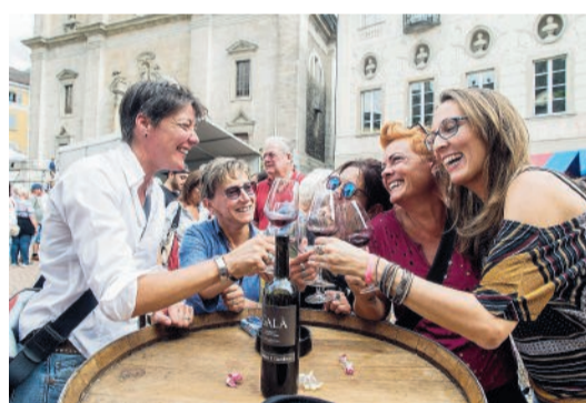
Il 3, 4 e 5 maggio nel centro storico