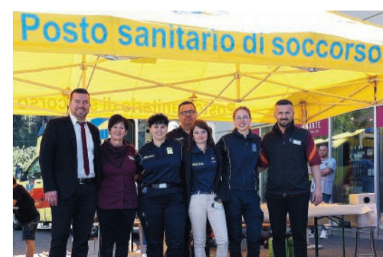
Al servizio della popolazione

Anche quest'anno la Federazione cantonale ticinese servizi ambulanza ha voluto sensibilizzare la popolazione in occasione della "Giornata svizzera d'azione 144" che cade il 14 aprile (14.4) ed è organizzata dall'Interassociazione di Salvataggio per promuovere a livello nazionale il numero 1-4-4. Tre Valli Soccorso ha dunque aderito alla giornata di sensibilizzazione sul numero per le emergenze sanitarie 144. Infatti molte persone non sanno ancora quale sia il numero da comporre in caso di necessità. Durante la giornata di sabato l'ente era presente all'esterno della Migros di Biasca a disposizione della popolazione per rispondere a eventuali domande e per farsi conoscere.