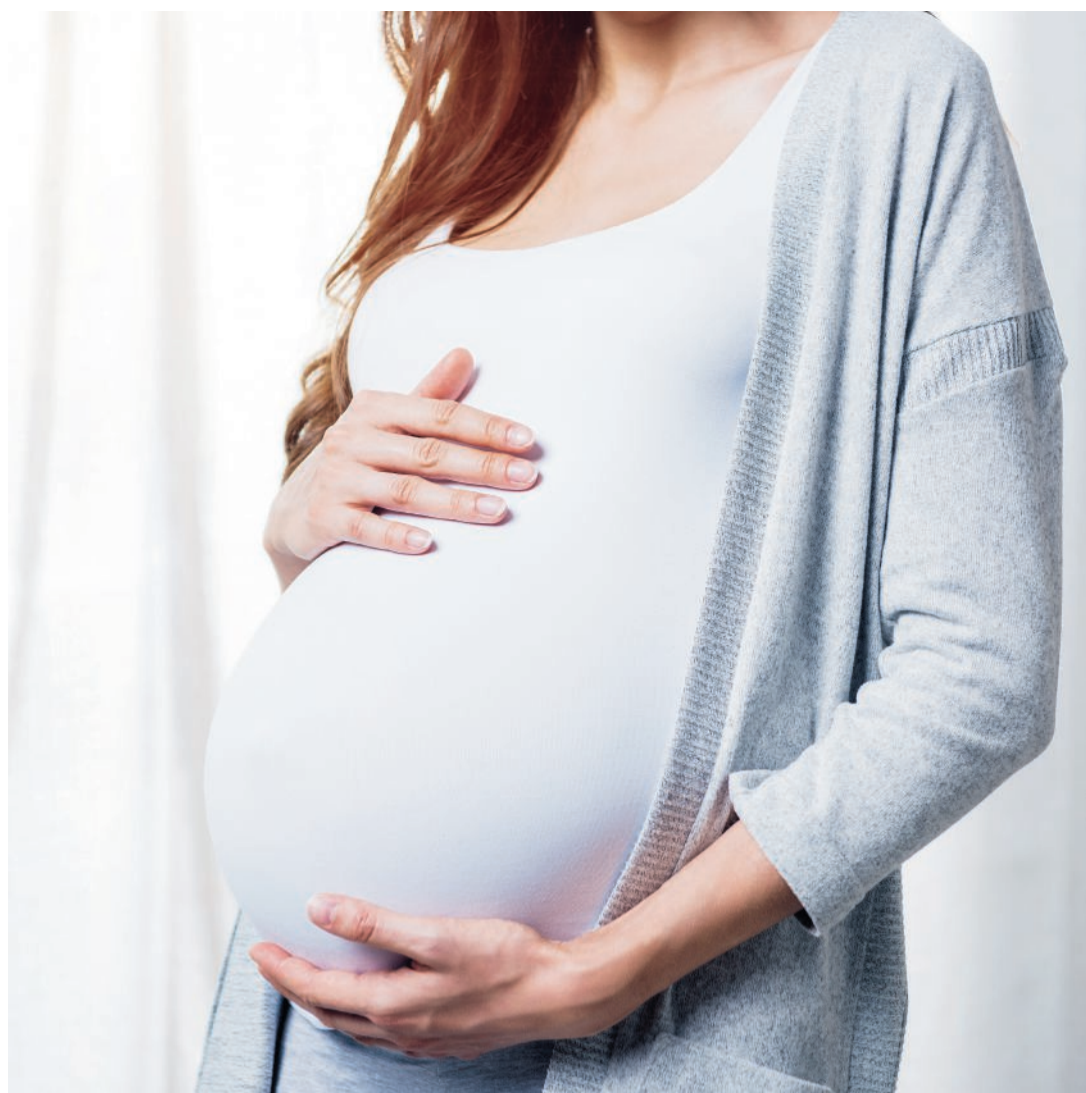
Momenti intensi per tutta la famiglia

I primi incontri verteranno su tre tematiche diverse. «Favorire le competenze della mamma e del neonato: conoscerli per vivere al meglio la gravidanza, il parto e l'accudimen-